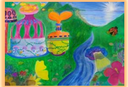
美しい木々や草花を育てる 栄養製造ハウス