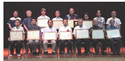
第54回の表彰式の様子