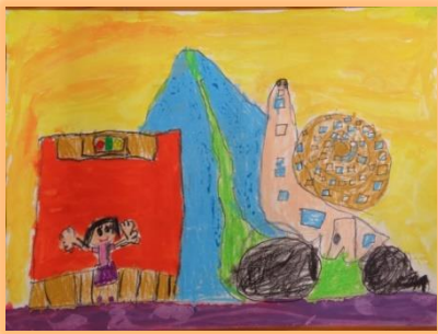
カタツムリのキャンピングカー

ドローンと一体化したAEDです。発信元のスマホの電波を受信して飛んでいきます。ドローンが着陸したら、近くの人がAEDをセットして救助します。