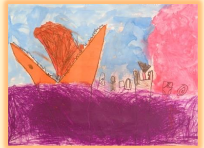
海のゴミを食べる恐竜ロボット