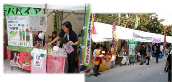
昨年度(H25)出展者の様子