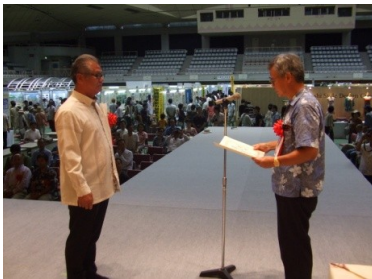
金秀バイオ 株式会社