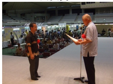
株式会社 エコライフビジョン