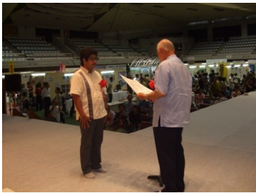
株式会社 新喜アクティブセンター